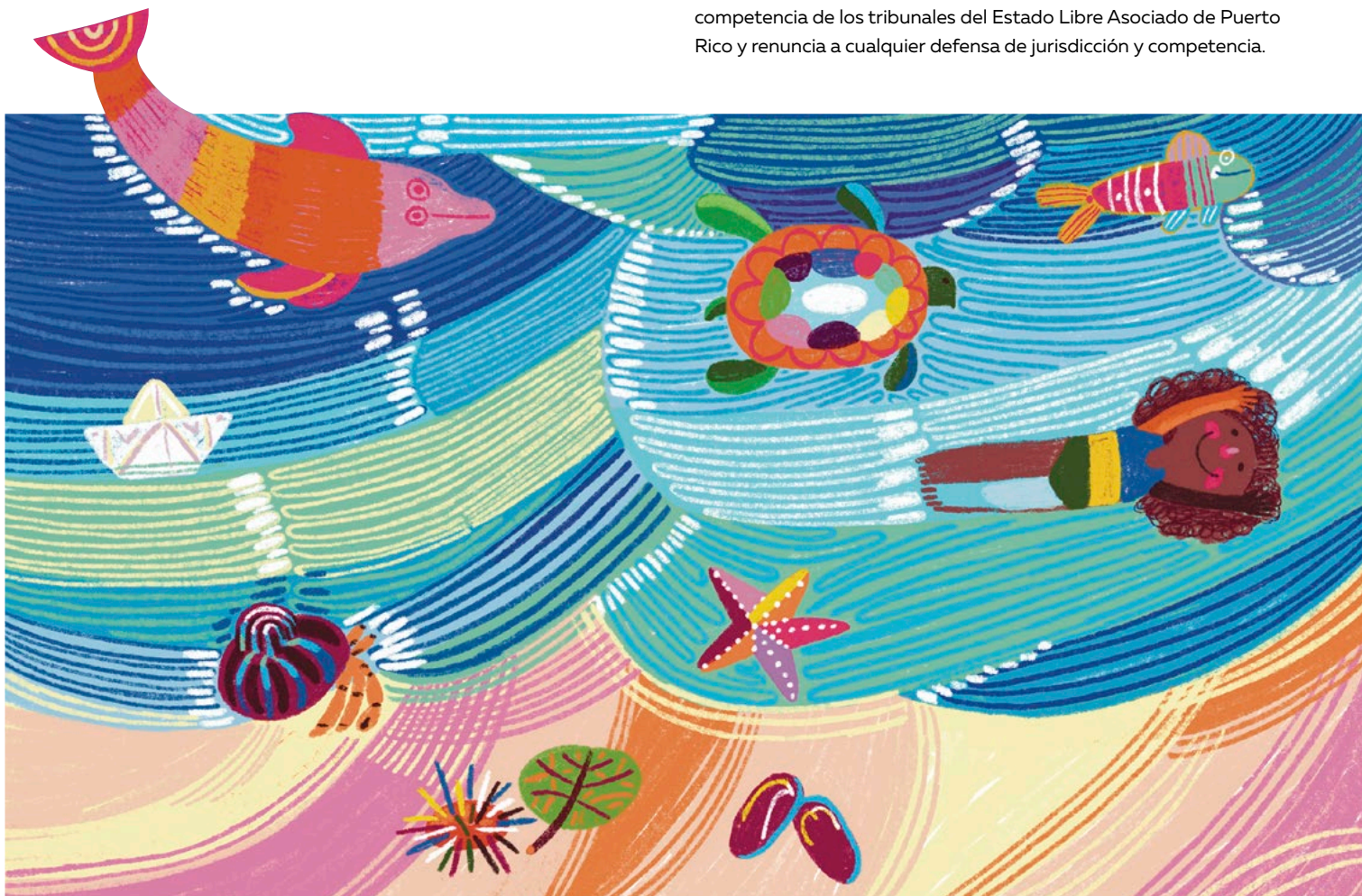
Ilustración: Mirinali Álvarez Astacio

La presente convocatoria está regida por las leyes del Estado Libre Asociado de Puerto Rico. Cualquier disputa o controversia en torno a la relación contractual entre el participante y SM podrá ser dirimida únicamente en los tribunales del Estado Libre Asociado de Puerto Rico. El participante se somete voluntariamente a la jurisdicción y competencia de los tribunales del Estado Libre Asociado de Puerto Rico y renuncia a cualquier defensa de jurisdicción y competencia.