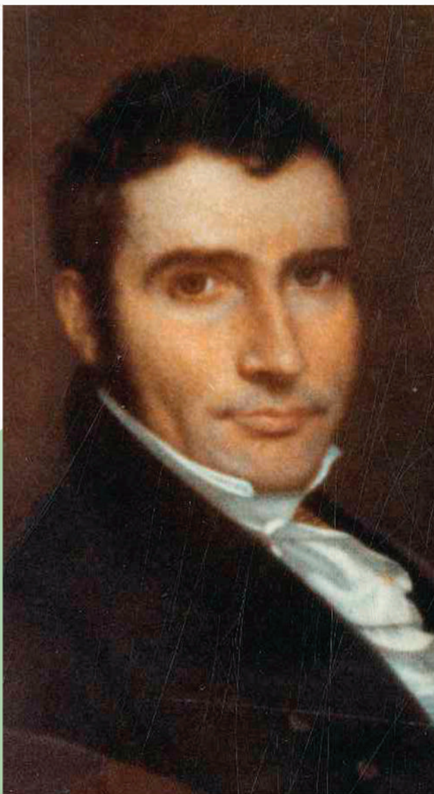
BARTOLOMÉ J. GALLARDO (1776-1852)

BIBLIÓGRAFO, ERUDITO y ESCRITOR. BIBLIOTECARIO DE LAS CORTES DE CÁDIZ.