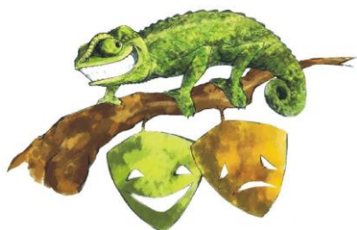
TEATRO EL LUGÁ