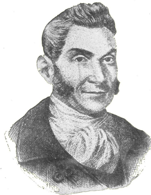
DON BARTOLOMÉ JOSÉ GALLARDO (1776-1852)