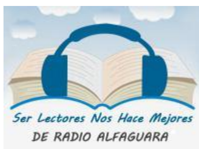
Programa de Radio